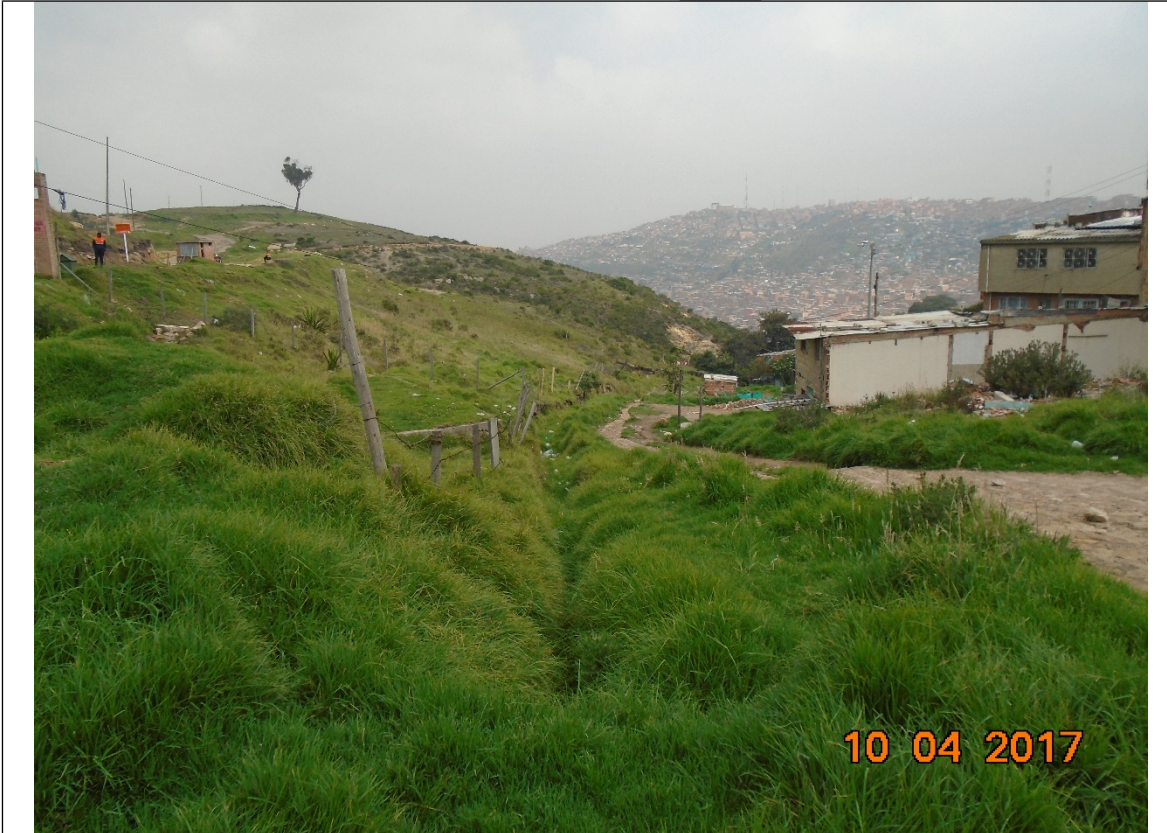
Fotografía 1. Punto de posible intervención por construcción de Box Coulvert en la coordenadas de X=89639,68 y Y= 96656,70