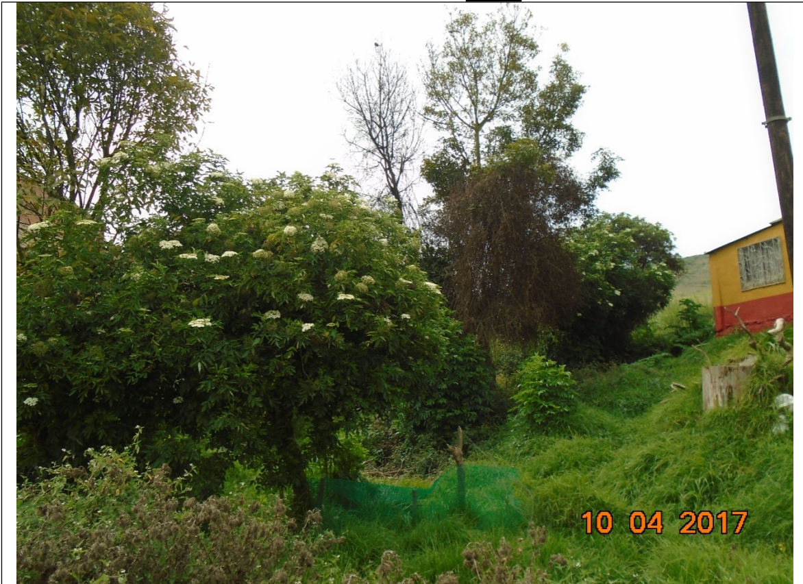
Fotografía 2.. Individuos arbóreos en la zona del proyecto.